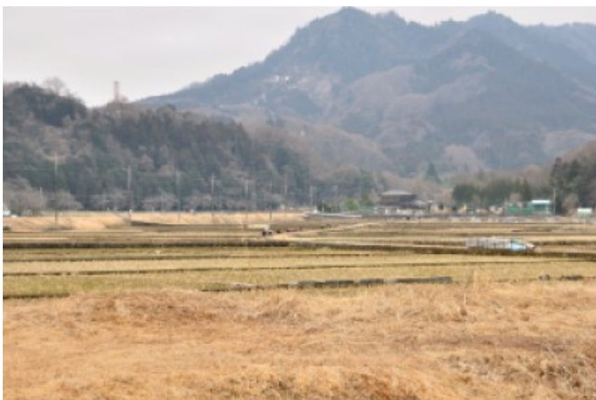
2012/03/04 12:45:47 里山風景

2012/03/04 14:08:00 鳥合わせ 見聞きした鳥 37種+外来種1