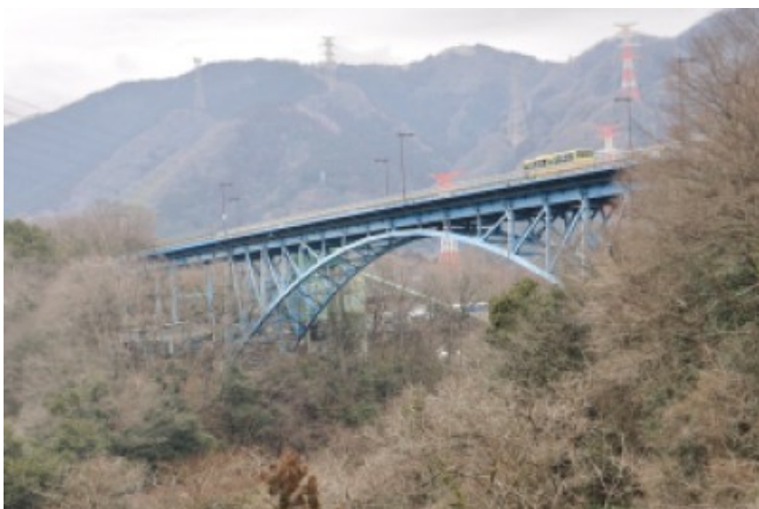
2012/03/04 09:34:33 道志橋