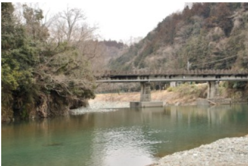
2012/03/04 11:02:52 弁天橋